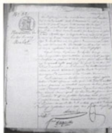
L'acte de naissance d'Hector Malot.

C'est dans cette mairie, faisant face au Grenier à sel, – Jean-Baptiste Malot y fut maire pendant 22 ans ! –, qu'a été rédigé l'acte de naissance du romancier, aujourd'hui consultable dans l'actuelle mairie.