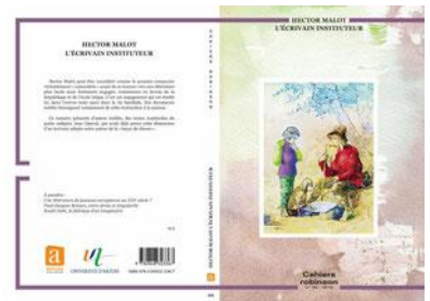
"MALOT, L'ÉCRIVAIN INSTITUTEUR"